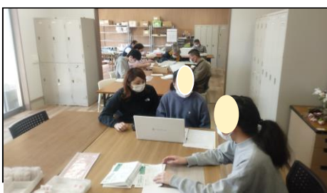
実際に施設を使用していることが分かる写真