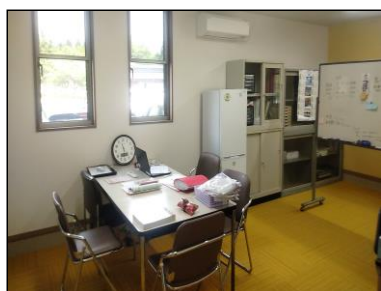
建物内部・職員室