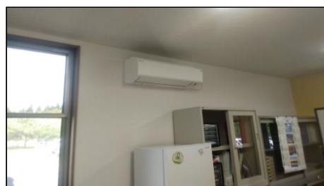
補助対象設備・エアコン