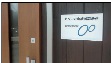
正面玄関・補助標識