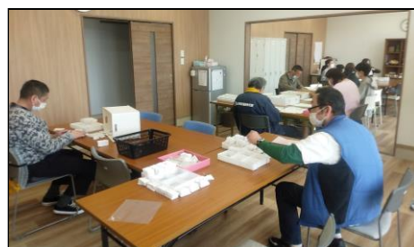
実際に施設を使用していることが分かる写真